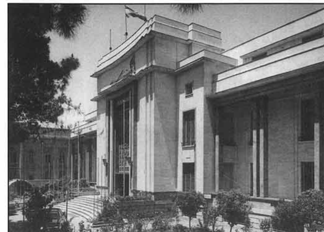
بانک سپه، شعبه مرکزی، میدان توپخانه

خشنود باشد بلکه باید از تأثیر اجتماعی آثار خود نیز قلباً اظهار رضایت کند. هوانسیان از جمله معماران ایرانی است که به همراه سایر تحصیل کرده‌های خارج از کشور پس از بازگشت به ایران در روند تحولات داخلی سهمی عمده در تغییر و توسعه معماری روز ایران در اوایل قرن بیستم داشته است.