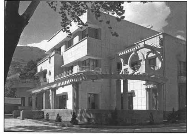
کاخ سعد آباد